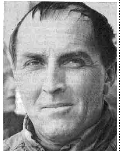
[1][2] Nevesport 30 aprile 1970

formazione allenatori. Segue ovviamente l'immane serie di ringraziamenti. [2]