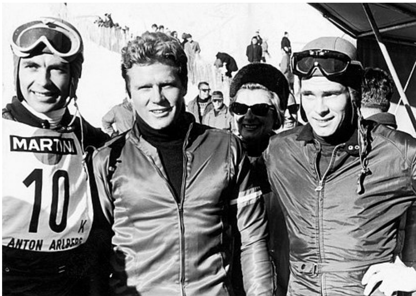
Gli «assi» della squadra austriaca di discesa libera degli anni '60: al centro Gerhard Nening fra Karl Schranz e Heini Messner

risultati conseguiti gli valsero un altro argento in combinata alle spalle del tedesco Ludwig Leitner.